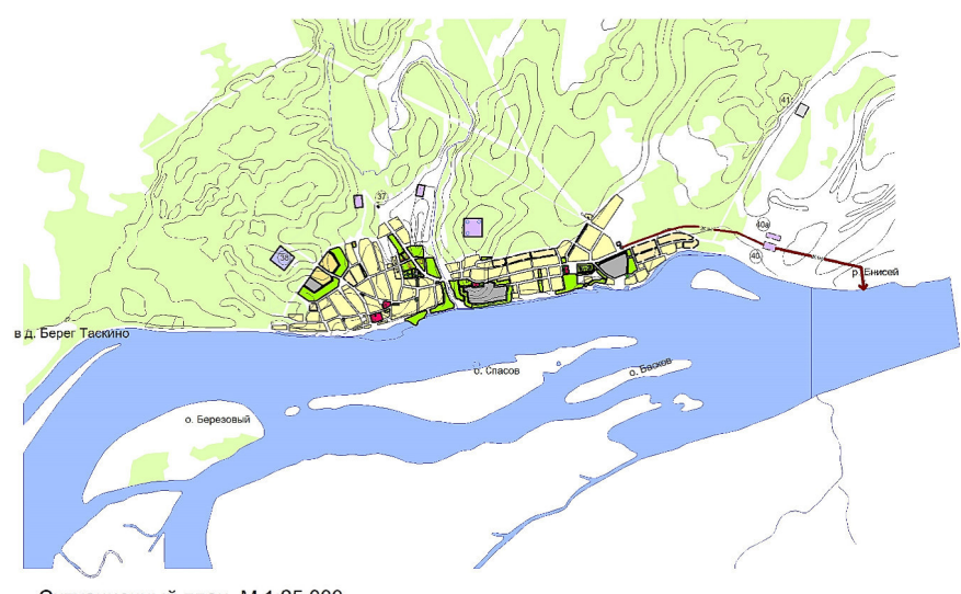
Ситуационный план М 1:25 000