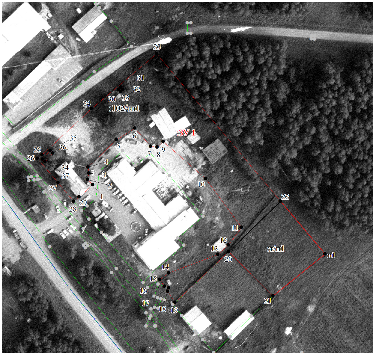
СХЕМА РАЗМЕЩЕНИЯ ТЕРРИТОРИЙ В СТРУКТУРЕ ПОСЕЛЕНИЯ