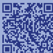
Видеоролики по профилактике экстремизма