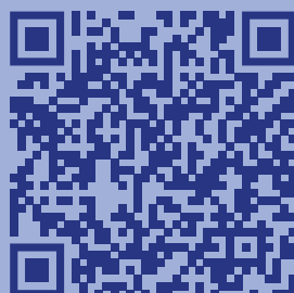
Материалы для проведения квеста