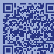
Материалы по профилактике экстремизма