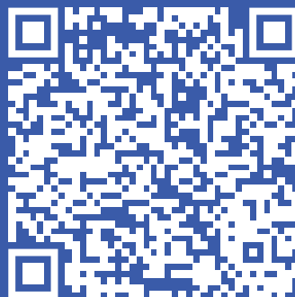
Короткометражные фильмы, которые можно посмотреть на профилактическом занятии 2 часть