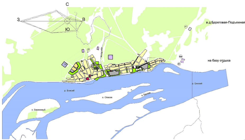
Ситуационный план М 1:25 000

ОСНОВНЫЕ ТЕХНИКО-ЭКОНОМИЧЕСКИЕ ПОКАЗАТЕЛИ